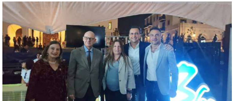
El Excelentísimo Embajador de Italia y representantes del Sistema Italia en Guatemala

En el marco del Día del Made in Italy (15 de abril), la Cámara de Comercio e Industria Italiana en Guatemala (CAMCIG) celebró la décima edición de Paseo Italia, una cita que, con el paso de los años, se ha convertido en el principal evento representativo del estilo de vida italiano en el país.