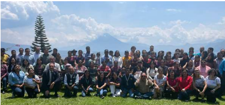
Foto de grupo con beneficiarios y socios del proyecto AlimentAcción durante el evento de cierre

Tras 36 meses de implementación, el proyecto AlimentAcción – Hacia la seguridad alimentaria en las comunidades rurales e indígenas mayas, se acerca a la conclusión con resultados significativos en la mejora de la disponibilidad, el acceso y el consumo de alimentos nutritivos en comunidades altamente vulnerables del suroccidente de Guatemala.