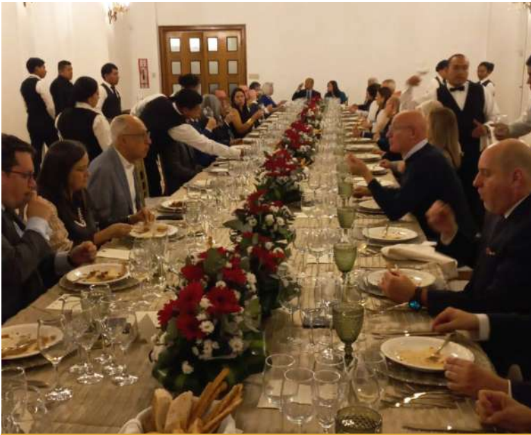
Un momento de la Cena ecuménica

El 19 de marzo, Guatemala marcó su lugar en el mapa mundial como un punto de encuentro donde las coordenadas de Italia con sus recetas tradicionales se trazaron junto a los sabores para mostrar su riqueza patrimonial.