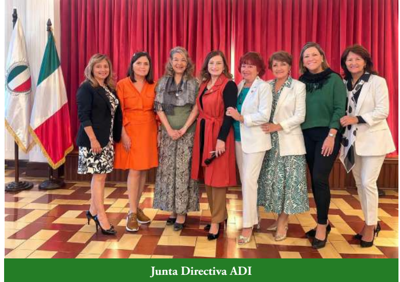
Junta Directiva ADI