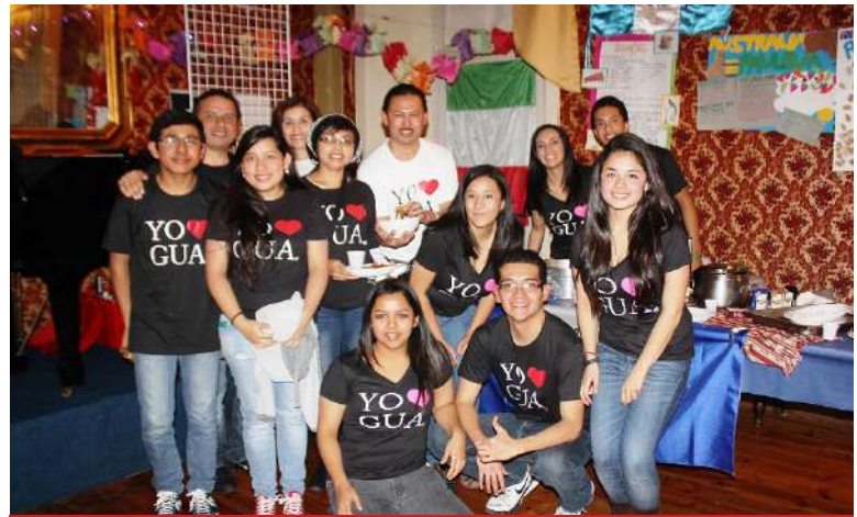
Guatemaltecos en el Viaje con Beca a Italia

Nos sentimos orgullosos de nuestra propuesta de vacaciones/estudio llevando adelante esta bella historia de compartir un gran amor por la lengua y la cultura italiana. Son ya más de 200 participantes quienes han viajado a tomar los Cursos de Lengua y Cultura Italiana, luego de mi orientación, durante más de 12 años. Desde 2025 nos complace ser socios de la Cámara de Comercio e Industria Italiana, CAMCIG.