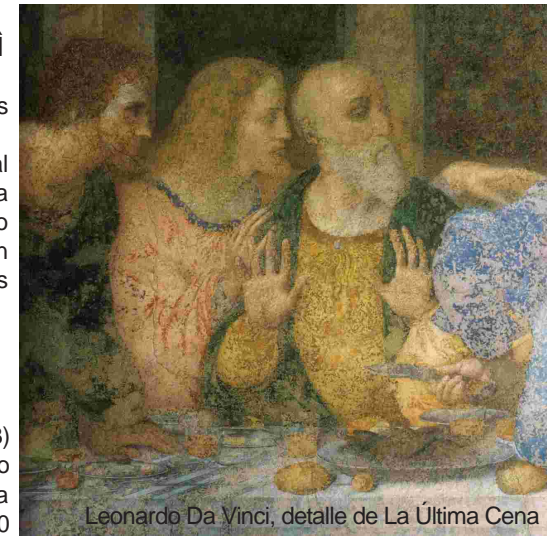
Leonardo Da Vinci, detalle de La Última Cena

viernes 7:30 pm / Hotel Intercontinental, zona 10 LA MAGÍA DE MILAN La moda, la gastronomía, la música. Un evento especial dedicado a la ciudad italiana que desde el pasado 1ero de mayo hospeda la Exposición Universal 2015. Una noche de moda, con desfiles de algunas de las más importantes marcas italianas presentes en el país, de gastronomía, con una exclusiva cena en la más pura tradición milanés, de música, con la actuación del destacado tenor Gustavo Palomo, y con muchas sorpresas más. Más información: Cámara de Comercio e Industria Italiana - CAMCIG, tel. 2367 3869.