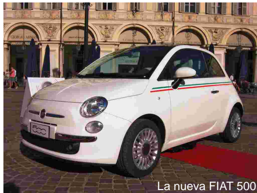
La nueva FIAT 500