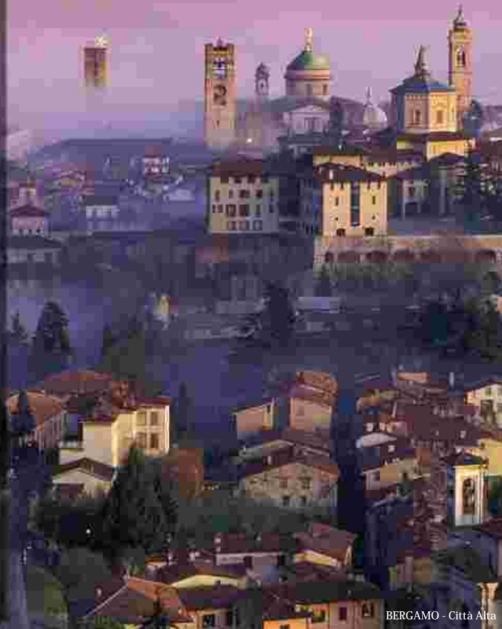
BERGAMO - Città Alta