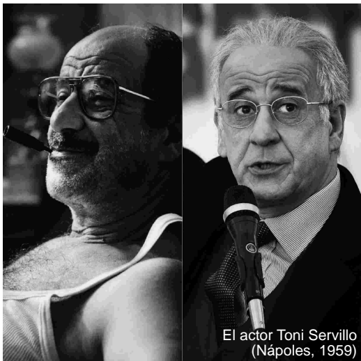
El actor Toni Servillo (Nápoles, 1959)

jueves 5 6:30 pm / Sede IIC LAS COMUNIDADES INDÍGENAS DE GUATEMALA DE CARA AL PROCESO ELECTORAL Conversatorio, con la participación de Andrea Ixchiu, columnista de El Periódico, Tomás Chiviliu, Alcalde de Santiago Atitlán, y Álvaro Pop, Experto independiente ante el Foro Permanente para las Cuestiones Indígenas de las Naciones Unidas. Modera Luigi Pierleoni, Cooperación italiana.