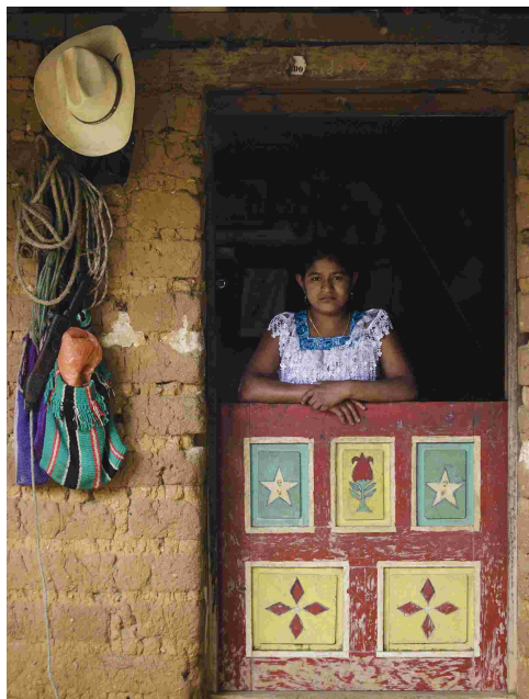
del libro Tierras Verticales