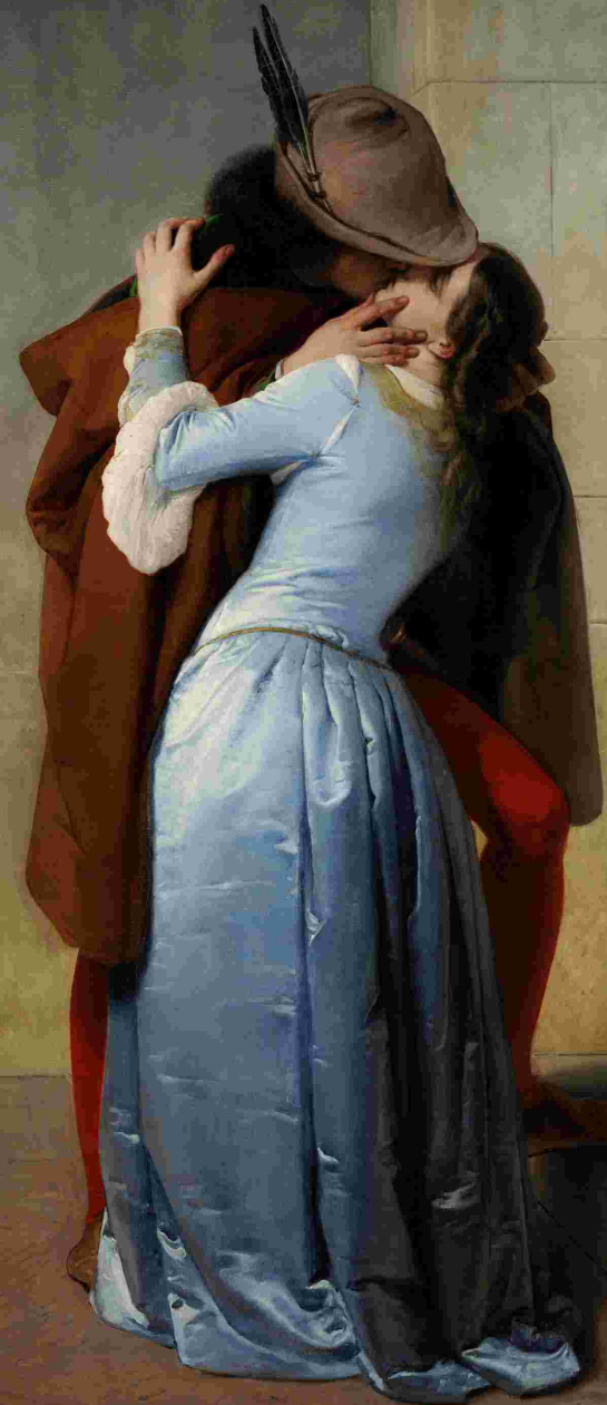
Francesco Hayez, IL BACIO (Milano - Pinacoteca de Brera)