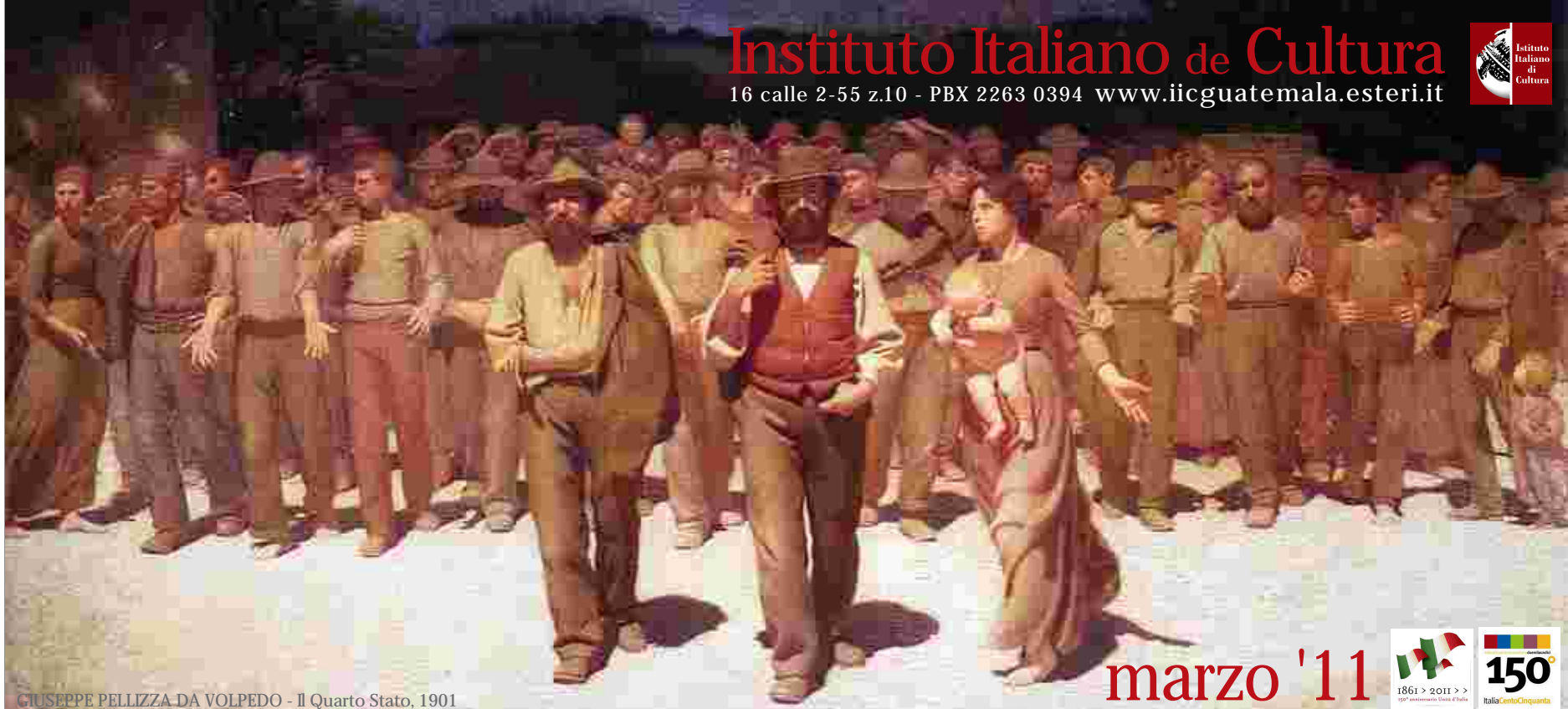
GIUSEPPE PELLIZZA-DA VOLPEDO - Il Quarto Stato, 1901