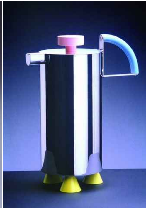
piezas en plata del siglo XX - Fundación Sartirana Arte