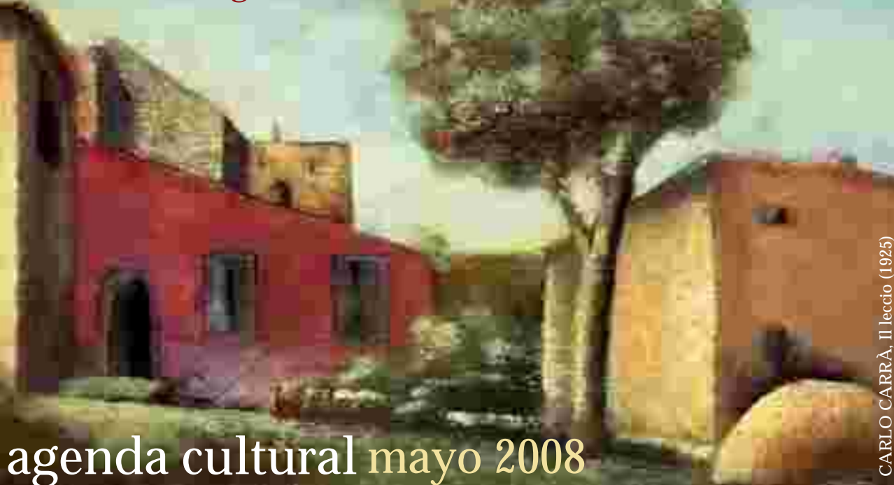
CARLO CARRÀ, Il leccio (1925)

16 Calle 2-55 zona 10 tels. 2366.8394 y 96 www.iicguatemala.esteri.it