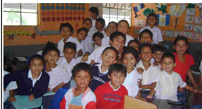
Alumnos de la Escuela Rural Mixta "Villalobos Sur"

"Momentos, lugares, personas amigas o desconocidas, todo un mundo que ha sido el mío durante cuatro años intensos de vida, trabajo, emociones, experiencias, encuentros, sueños, proyectos... Mi cámara los ha cristalizado en miles instantes de color, una memoria preciosa que es la materia de esta exposición. Cerrando una puerta, espero abrir ventanas. Las fotos exhibidas están a la venta y lo que se recaude será destinado a una escuela de Villalobos Sur. 400 niños, 12 maestros y una directora con quienes ya hemos convertido algunos sueños en realidades: una biblioteca, un programa de becas, capacitaciones de maestros, un aula multimedia, un techo nuevo... Cosas sencillas que marcan la diferencia."