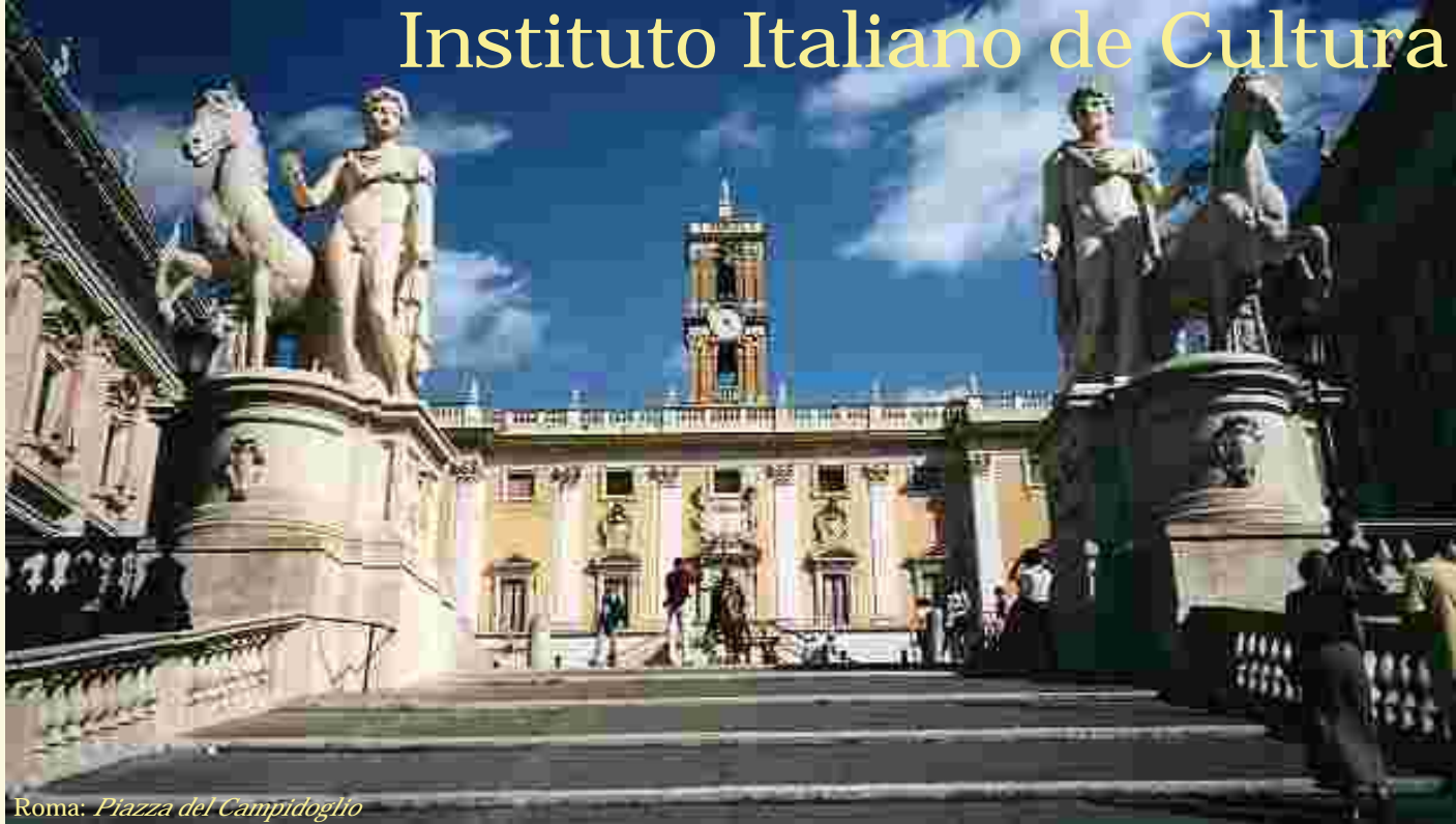
Roma: Piazza del Campidoglio