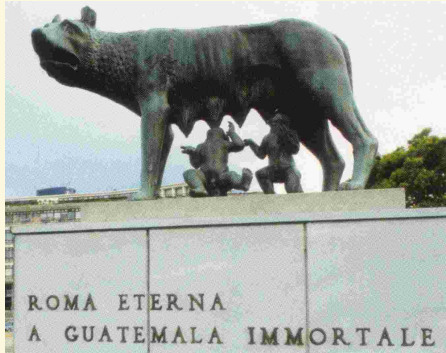
Guatemala: Monumento a la loba de Roma