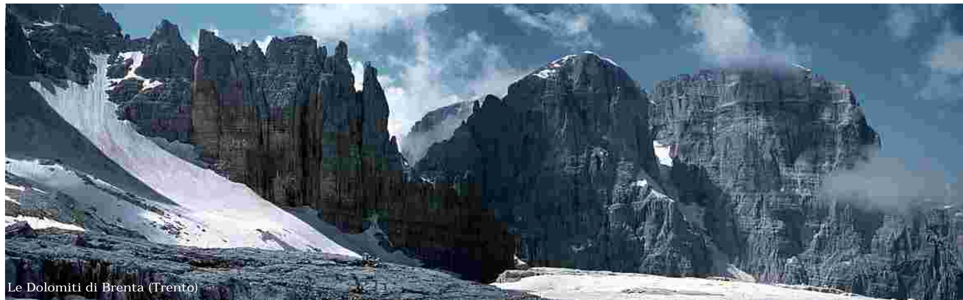
Le Dolomiti di Brenta (Trento)