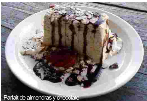
Parfait de almendras y chocolate